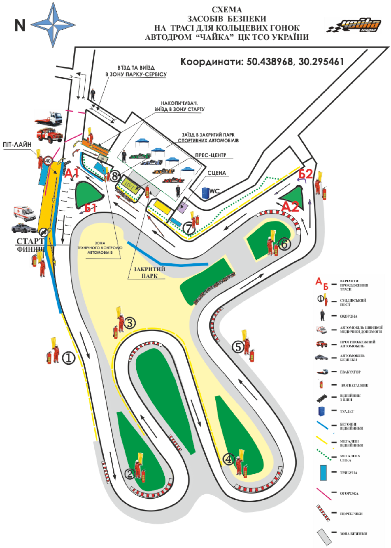
СХЕМА ТРАСИ ЗМАГАННЯ